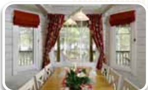
Mariebergin Loma Meritie 136, Иснес тел. +358 19 610 870, hotellihanhi@kolumbus.fi, www.marieberginloma.fi