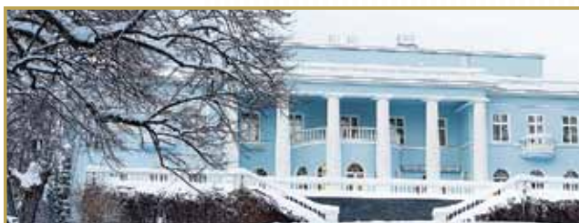
Отель «Haikko Manor & Spa», спа-комплекс и конференц-центр